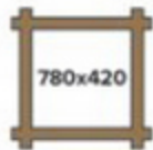
РАЗМЕР БЕСЕДКИ, СМ