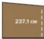
ВЫСОТА БЕСЕДКИ МИН