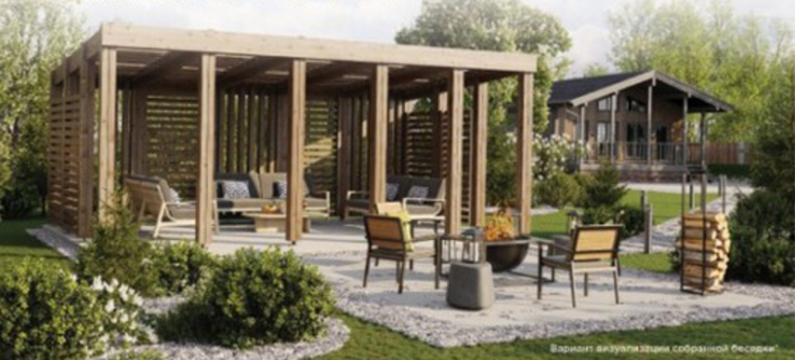
Вариант визуализации собранной беседки*