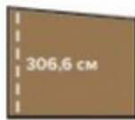
ВЫСОТА БЕСЕДКИ МАХ